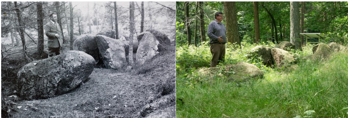
Foto Hunebed Sprockhoff nr 891 bij Bippen.

Uiteraard moet deze special in onze nieuwsbrief vermeld worden. Niet alleen omdat een belangrijk gedeelte over onze provincie gaat, maar ook omdat dit onderwerp uitvoerig beschreven wordt. Als belangstellende bezoek ik regelmatig de Duitse en Drentse hunebedden. Ik meen overigens ook een bepaalde kennis over dit onderwerp te hebben. In deze special las ik gelukkig ook nog dingen die ik niet wist. Dus zeer lezenswaardig. Het geeft een goed beeld van de stand van zaken rondom onze kennis over deze grafmonumenten. Het is ook een aansporing om eens even over de grens te wippen en onze Oosterburen een bezoek te brengen. De door mij reeds eerder genoemde "Straße der Megalithkultur" is goed bewegwijzerd.