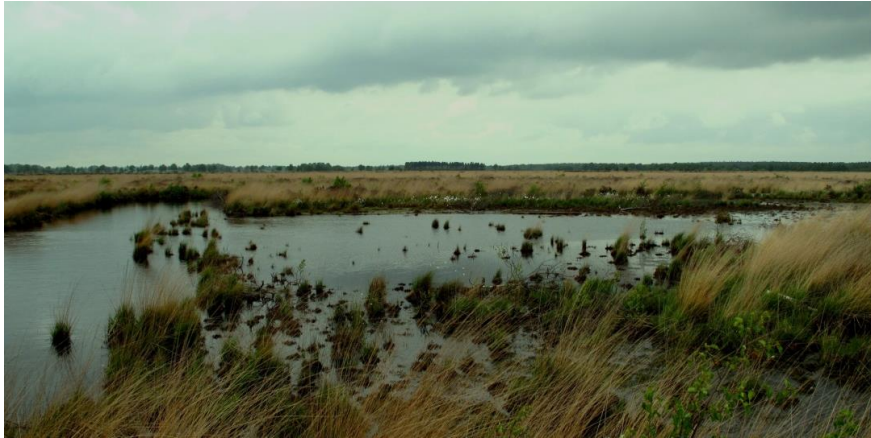
Veengebied in Noord Nederland.