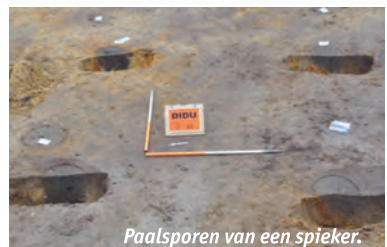
Paalsporen van een spieker.

Naast spiekers zijn er ook voorraadkuilen aangetroffen. De bewoners gebruikten die om goederen zo nodig koel op te slaan.